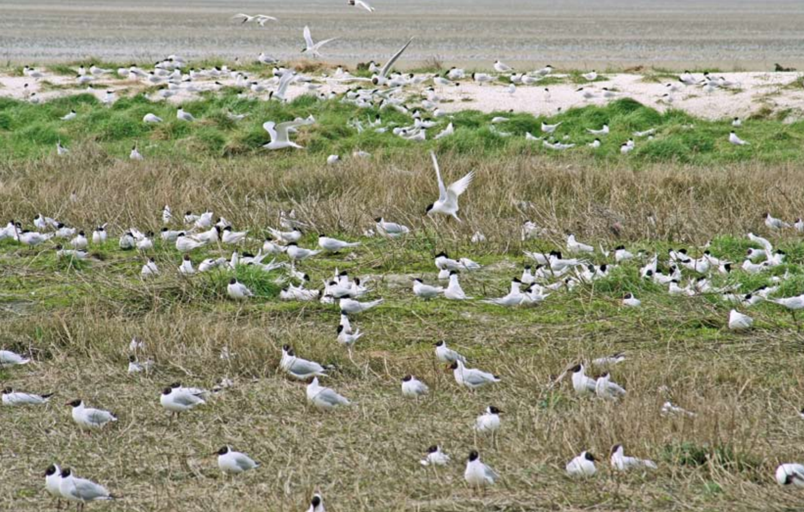
| Kokmeeuwen zorgen voor de "verdediging" van de Grote Sterns