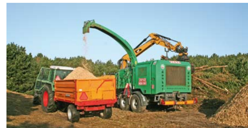
| Gekapte bomen zijn versnipperd

Niet alleen bij Ballum zijn we aan het werk geweest in het bos, ook in de Vleijen is gedund. Hier groeien vooral Pinus contorta's, een soort den. Deze soort groeit echter slecht op Ameland waardoor ze omvallen of krom gaan groeien. Door ze weg te halen krijgen andere soorten die het hier wel goed doen meer ruimte. Ook in 2013 zullen we stukken met de Pinus contorta blijven kappen.