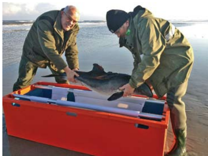
| Bruinvis op transport

Het is belangrijk dat de vogels en zeehonden op de plaat niet verstoord worden. Voorlichting van de bezoekers is daarom van groot belang. Vanaf mei tot en met half september bivakkeren vrijwilligers van de Vogeltelgroep Engelsmanplaat in het huisje als 'Waddengastheren of -vrouwen'. Zij informeren bezoekers van dit mooie gebied en zorgen ervoor dat recreatie en natuur op een goede manier samengaan.