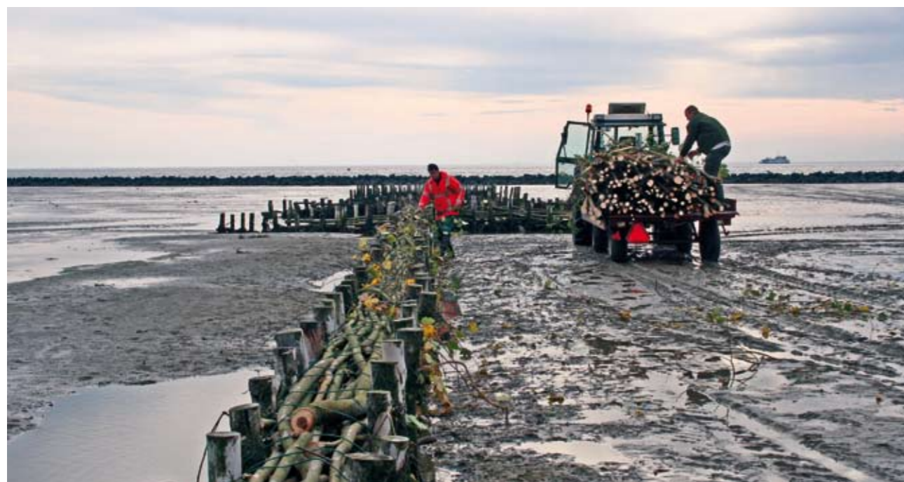
| Aanleg van rijshoutdammen

Die eerste effecten zijn al snel zichtbaar, zo wordt er al behoorlijk wat slib ingevangen en de aangebrachte kleischelpen worden ook al goed verspreid. In onze gedachten hadden we dat gehoopt, maar als het ook daadwerkelijk zo blijkt te werken dan is dat een fijne gewaarwording. Volgend jaar volgt de volgende uitdaging; het maken van een (levende) schelpdierenbank voor de kwelder, die op den duur als golfbreker kan gaan dienen, maar ook voor extra afzetting van slib op de kwelder moet gaan zorgen.