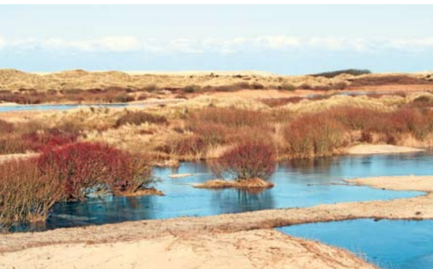
| Onder en boven: resultaat van plagwerkzaamheden in het duingebied

Behalve natuur beheert Staatsbosbeheer ook de ruiters-, wandel- en fietspaden in de natuurgebieden. We zorgen dat er geen gaten in de ruiterspaden zitten en dat overhangende en/of dode takken boven paden worden weggehaald. De Amelandse fietspaden zijn het afgelopen jaar in het nieuws geweest met de vraag of de schelpenpaden nog wel betaalbaar zijn. Dat is ook een vraag die wij ons stellen voor de 5 á 6 kilometer fietspad die wij in beheer hebben. We kijken naar alternatieven zoals beton of asfalt, maar die kunnen niet tippen aan het nostalgische beeld van de witte paden door de duinen met het kenmerkende geluid van de knisperende schelpen. Ook de banken, tafels en prullenbakken worden wekelijks gecontroleerd.