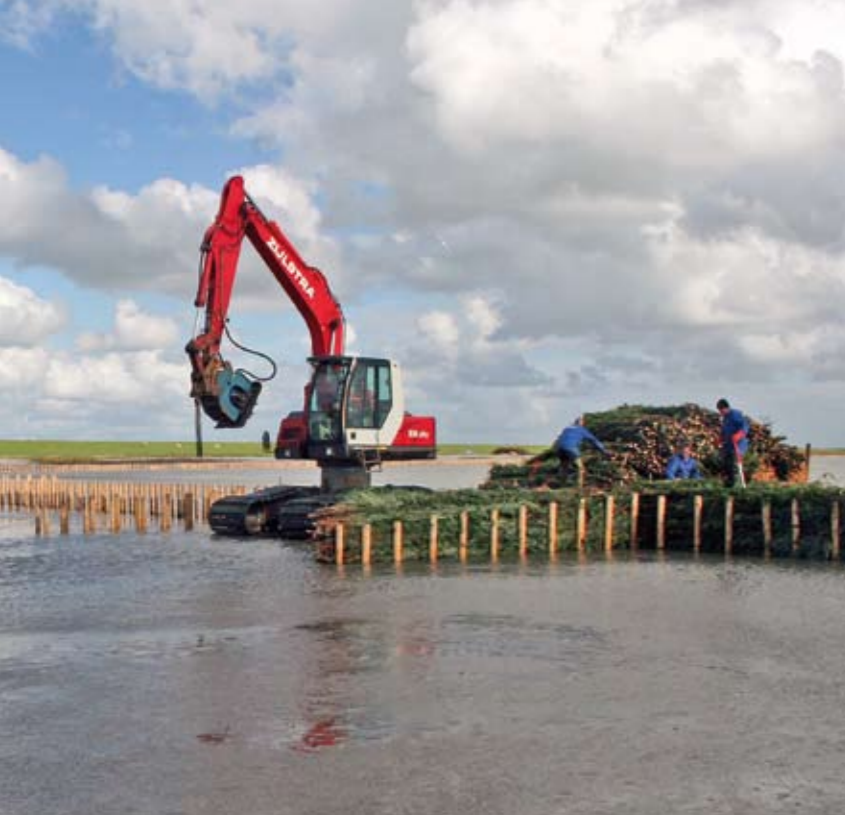
| Voor de rijshoutdammen zijn sparrentakken gebruikt