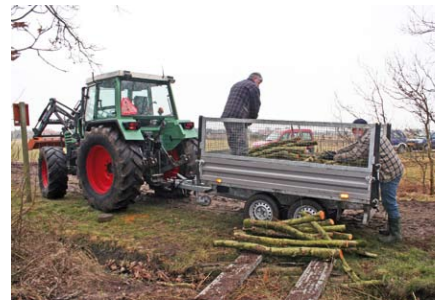
| Verzamelen van kachelhout