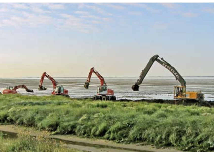
| Grote inzet van materieel