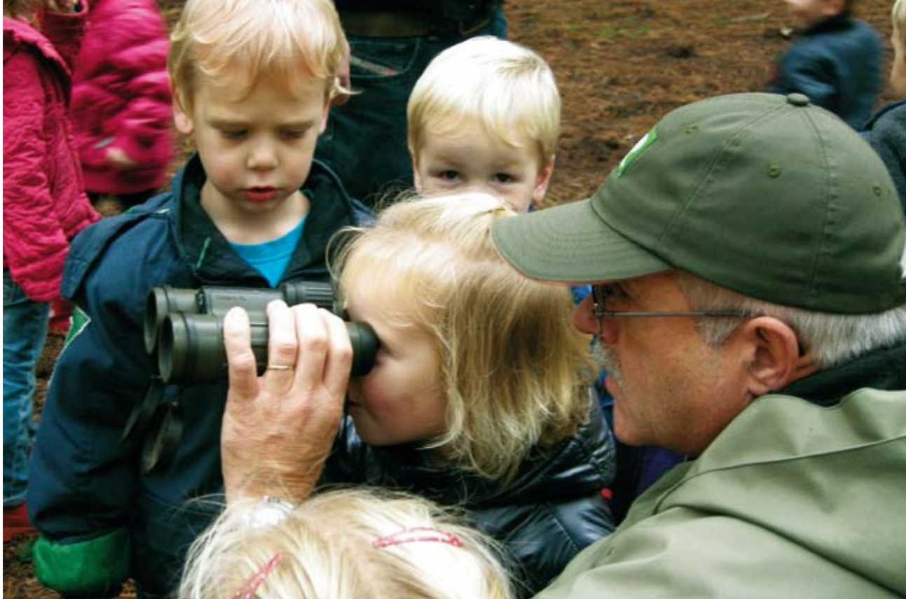
| Excursie met peuters in de natuur