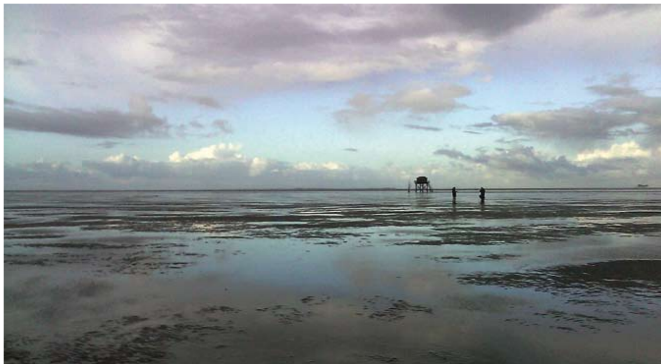
| Waddengastheren op Engelsmansplaat