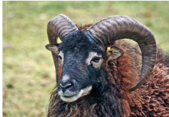
| Soay schaap

Samen met It Fryske Gea werkt Staatsbosbeheer op Ameland aan het herstel van de duinen. De eerste twee deelprojecten, die bestonden uit het afplaggen van delen van het duingebied, zijn in 2012 uitgevoerd in de gebieden van It Fryske Gea en de Vennoot. In 2013 is een deel van de Zwanewaterduinen aan de beurt, hier zal een oud duin worden afgeplagd. Al met al is voor dit herstelproject 10 jaar uitgetrokken. Er zullen nog meerdere gebieden aangewezen worden om af te plaggen. Het gehele project kost zo'n 10 miljoen euro en wordt gefinancierd door energiebedrijven RWE en Nuon.