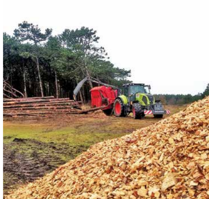
| Takken en boomtoppen versnipperen we voor gebruik als biomassa.