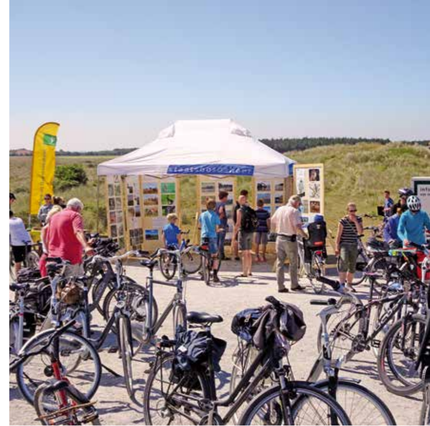
| De Fietsdag is een jaarlijks evenement van Rijkswaterstaat en Staatsbosbeheer.

Vaste prik: op de vrijdag na Hemelvaart organiseren Rijkswaterstaat en Staatsbosbeheer gezamenlijk de Fietsdag. Via een mooie fietsroute komen de deelnemers meer te weten over de natuur van Ameland en het werk van beide organisaties. Traditiegetrouw doen er ook veel eilanders mee aan deze dag. De fietsdag is geen gewone gemarkeerde fietsroute. Aan de hand van puzzelopdrachten moeten de deelnemers zelf de route zien te bepalen. Deze startte en eindigde in het centrum van Ballum, zodat deelnemers na afloop ook de andere activiteiten die daar die dag georganiseerd werden konden bezoeken.