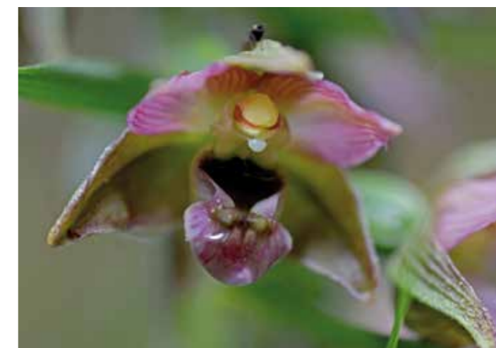
| De brede wespenorchis groeit op Ameland op verschillende plekken langs de bosspaden.