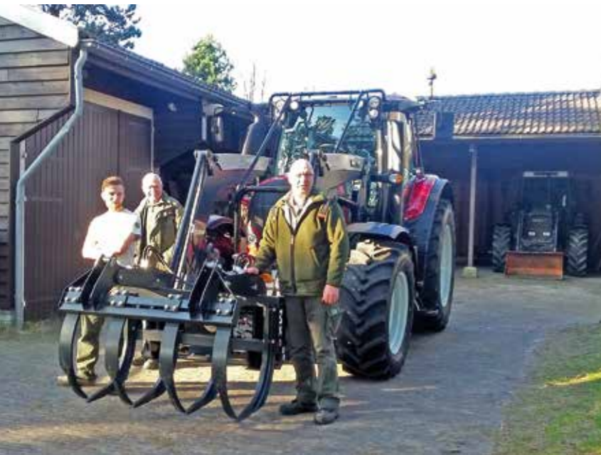
| De nieuwe trekker, met op de achtergrond de oude trouwe Fendt.