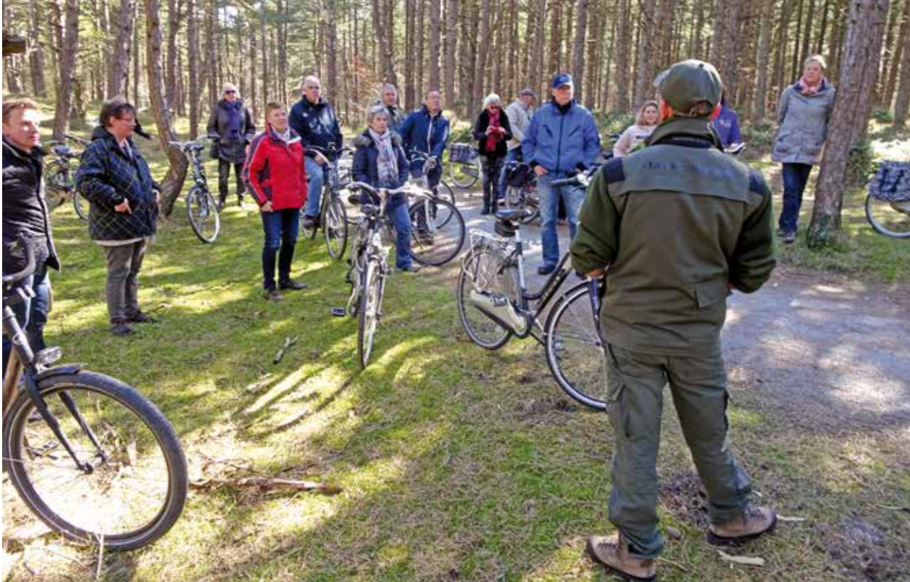
| De excursies met de dorpen zijn voor herhaling vatbaar.