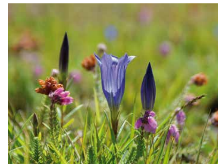
| De klokjesgentiaan profiteert van begrazing. | Moeraswolfsklauw vind je in enkele natte duinvalleien.