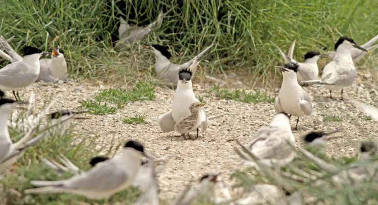
| Voor de grote sterns op de Fuegelpôle is het broedseizoen mislukt.