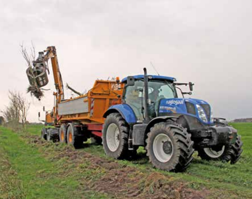
| Langs de Langweerdijk zijn zieke essen verwijderd.