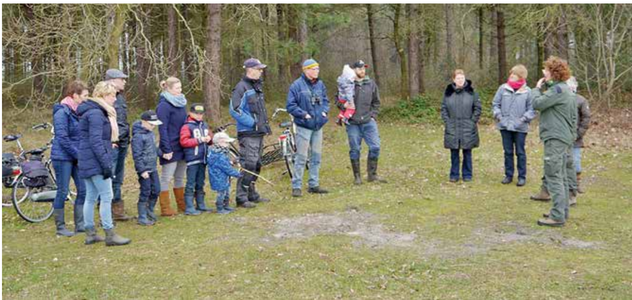
| Onder andere het bosbeheer was onderwerp van gesprek.

Begin 2017 hebben alle buurtschappen op het eiland een uitnodiging van Staatsbosbeheer ontvangen om gezamenlijk op excursie te gaan. Doel hiervan was om elkaar op de hoogte te brengen van zaken die leven in het buurtschap en uitleg te geven over het beheer van Staatsbosbeheer in de omliggende gebieden. Met veel plezier zijn we met de Buurtschappen van Nes, Hollum en Ballum op pad geweest. De reacties waren erg positief. Er is daarom afgesproken dit jaarlijks te herhalen. Bij elk dorp zijn we naar hun 'achtertuin' gegaan. Het bosonderhoud, de bescherming van de Feugelpölle, begrazing in de terreinen, de waterhuishouding bij het Hagedoornveld en recreatie in de bossen waren onderwerp van gesprek.