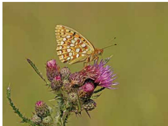
| De duinparelmoervlinder is één van de twee parelmoervlinders op Ameland. | Parnassia groeit in de kalkrijke en natte duinvalleien.

De Programmatische Aanpak Stikstof (PAS) is een landelijk programma dat de natuurkwaliteit moet verbeteren en tegelijk economische groei mogelijk moet houden. De beheermaatregelen die in de Programmatische Aanpak Stikstof zijn opgenomen zijn nodig omdat de duinen steeds meer vergrassen en verruigen door een toenemende invloed van stikstof, veroorzaakt door verkeer, industrie en landbouw. Dit gaat ten koste van de kwetsbare duinnatuur omdat grassen de kenmerkende duinplanten overwoekeren, stikstof werkt namelijk als een meststof. Daarmee verdwijnen ook insecten en vogels die in de duinen thuishoren. Door aan de ene kant de invloed van stikstof op de natuur te verminderen en aan de andere kant de uitstoot van stikstof te reduceren, blijft er ruimte voor de groei van bedrijven en verkeer. De maatregelen in de duinen van Ameland bestaan uit drie dingen: duinen afplaggen (voedselrijke laag afgraven), meer begrazen en duinen weer laten stuiven. Dat houdt in dat er samen met Gemeente Ameland, Rijkswaterstaat en It Fryske Gea gekeken gaat worden waar dit allemaal mogelijk is. Nadat de eerste plannen zijn uitgewerkt, leggen we dit voor aan de eilander klankbordgroep. In deze groep zitten vertegenwoordigers van verschillende organisaties en bedrijven op Ameland. De Provincie Fryslân registreert dit hele project en is ook eindverantwoordelijke, de terreinbeheerders zijn verantwoordelijk voor de uitvoering.