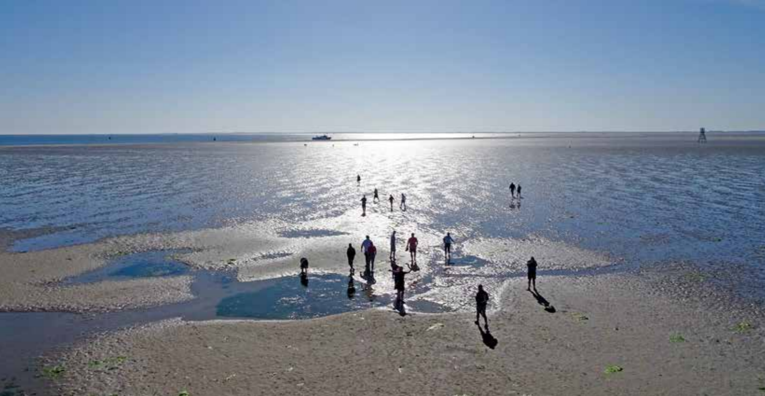
| Jaarlijks bezoeken naast duizenden vogels ook veel wadlopers Engelsmanplaat.