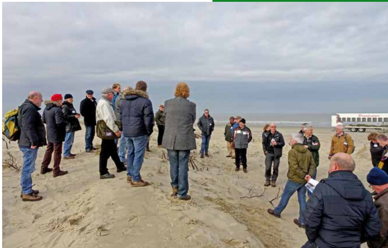
| Kennisuitwisseling met Terschellingers over het beheer van het eiland.