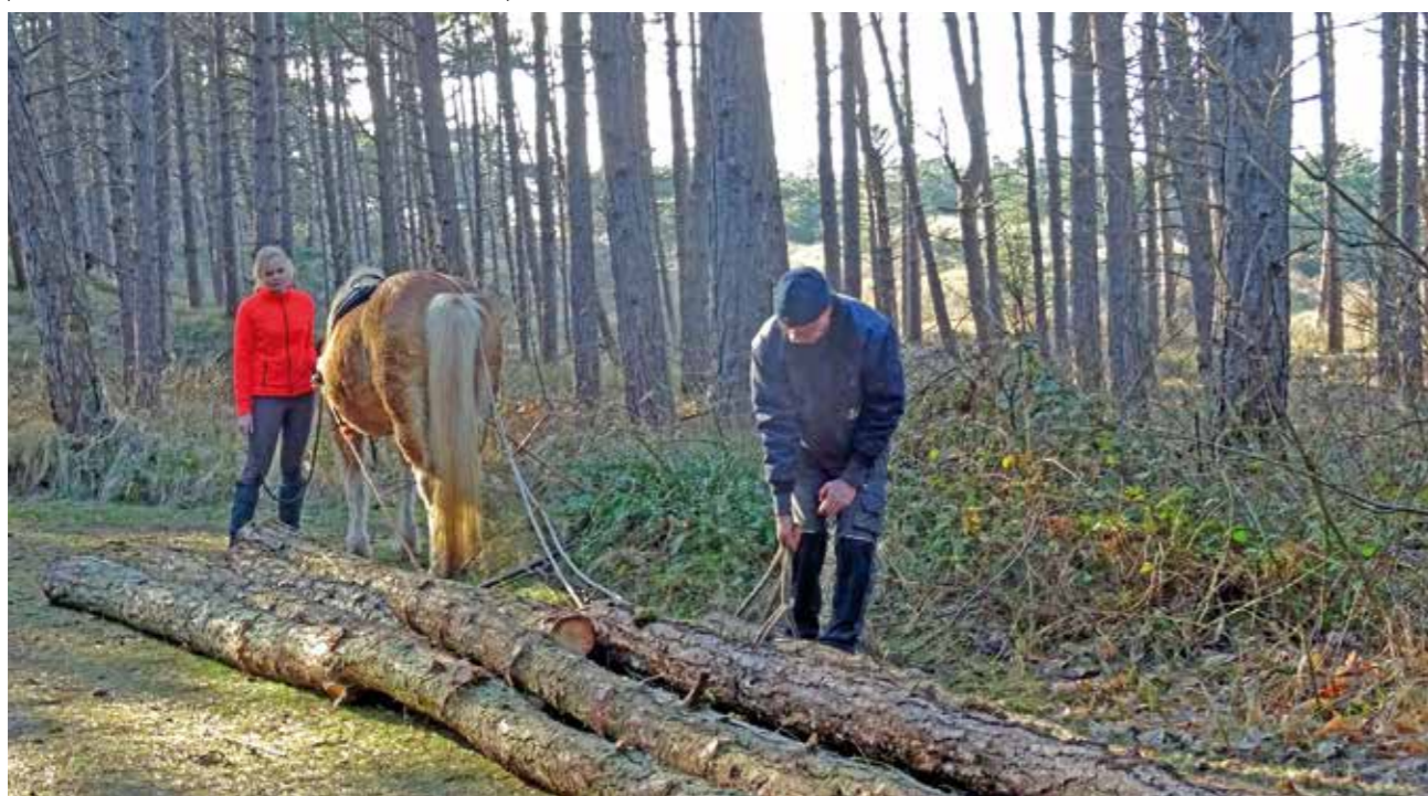
| Behalve machines zetten we soms ook ouderwetse paardenkrachten in.

In 2017 werd duidelijk dat grote aantallen essen in Nederland besmet zijn met een schimmel. Deze veroorzaakt zogenaamde essentaksterfte, een ziekte waaraan de bomen uiteindelijk sterven. De schimmel komt oorspronkelijk uit Azië en is per ongeluk ingevoerd in Europa. Hij verspreidde zich met de wind en kan zo kilometers overbruggen. Om verdere verspreiding van de ziekte te voorkomen kapt Staatsbosbeheer landelijk noodzakelijkerwijs grote stukken bos met essen. Op Ameland blijft de schade gelukkig beperkt omdat hier weinig essen staan. Langs de Landweerdijk hebben we een windsingel verwijderd. Middenin een bosvak bij de Vleijen staan ook essen. Deze blijven nog even staan, zolang ze geen gevaar voor voorbijgangers vormen.