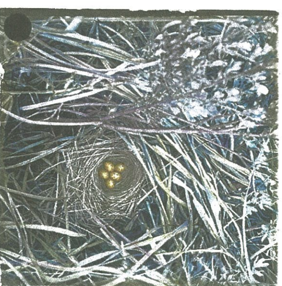
'Nest van een Klauwier' (1907-1923).