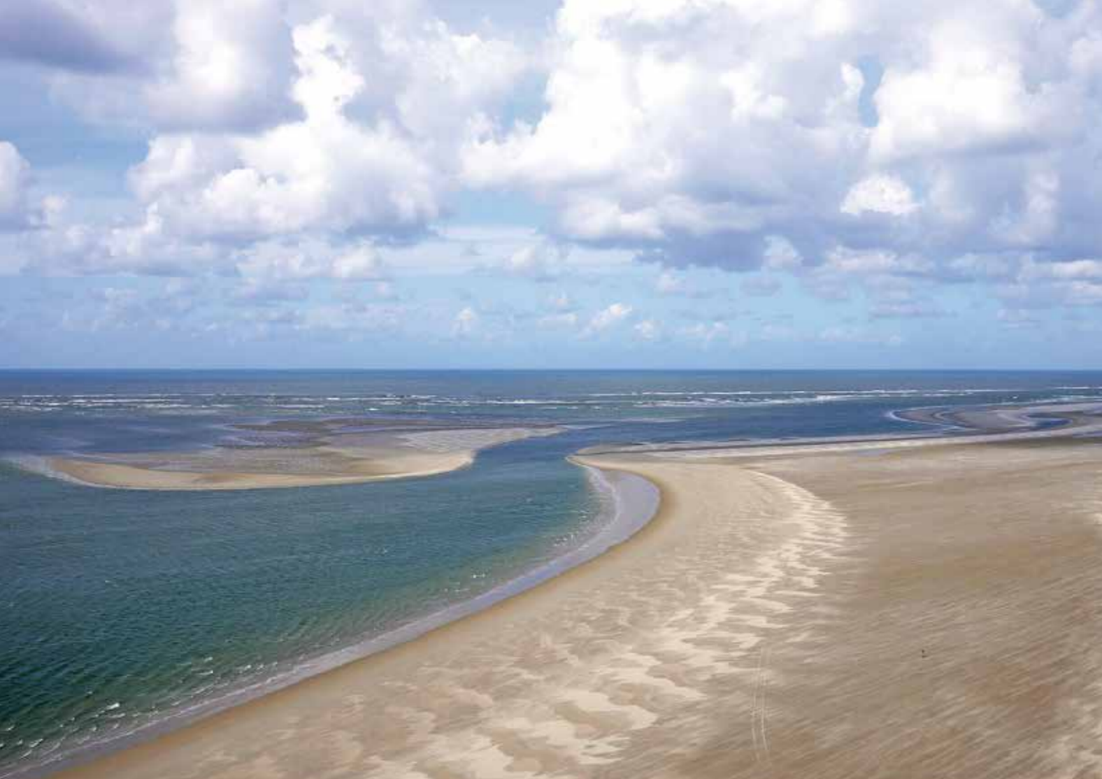
! Bij paal 4 groeit een grote zandplaat vast aan Terschelling, dit zand verspreidt zich langs het strand en versterkt de kust van Terschelling. ! Tussen paal 15 en 20 wordt zoveel zand vastgehouden dat zich een geheel nieuwe hoge duinenrij heeft ontwikkeld (rechts).