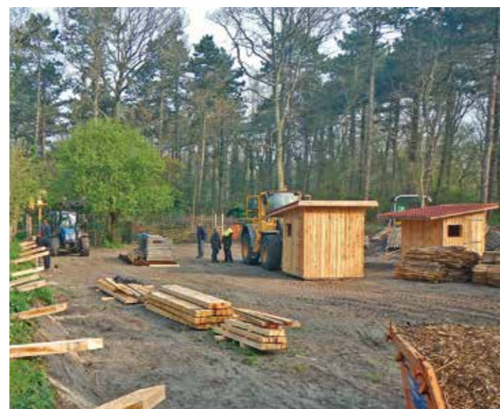
| De aanleg van de tuinen door studenten en aannemers.

duurzame tuin. De tuinen zijn onder andere voorzien van een ree- en konijnwerende omheining en een houten schuurtje met zonnepaneel voor de aandrijving van bijvoorbeeld een pomp. Het beheer is in handen van drie eilanders. Binnenkort geven we ook andere tuinhuurders de mogelijkheid om hun tuinen in te richten, gebruikmakend van de ideeën uit de 'Ideale tuin'. Bestaande vervallen hokjes en hekwerken kunnen we dan saneren. Hierdoor krijgt het tuintjesgebied een beter landschappelijk aanzien, terwijl de charme van de diverse karakters van de tuintjes behouden blijft.