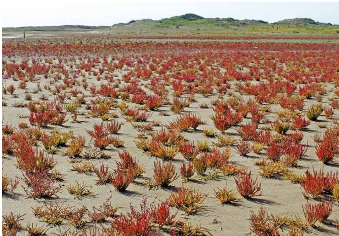
| Op de Noordsvaarder ontwikkelt zich ieder jaar een groot zeekraalveld.

Natuur, recreatie en strandrijden Dit jaar was het voor het eerst mogelijk om in oktober al op een deel van het strand te rijden, als compensatie voor het afsluiten van een deel van het strand in de Kerstvakantie. Samen met de leden van het Strandoverleg (Gemeente Terschelling, Land Roverclub, Stichting Houdt van het strand) hebben we afspraken gemaakt over de gebieden waar