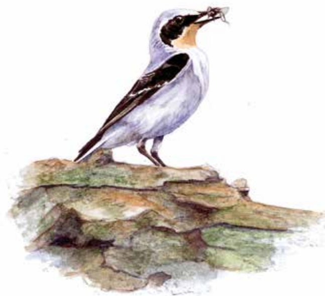
| De tapuit profiteert van begrazing.