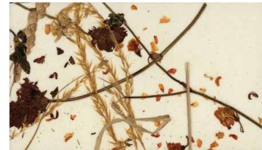
| Biokaarten gemaakt van materiaal van het eiland, 100% Terschelling.

we geïnteresseerden de mogelijkheid om een bankje op een bestaande locatie te adopteren voor een vast bedrag. Van dit geld betalen we het onderhoud voor de volgende jaren. Op de rugleuning kan op verzoek een metalen plaatje geplaatst worden met daarop een passende tekst.