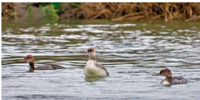
| Middelste zaagbek met jongen in de Vijfde slenk.

gereden mag worden. De uiteinden van het eiland, voorbij paal 3 en paal 26, behoorden in oktober niet tot het opengestelde stuk omdat hier in deze maand nog veel trekvogels rusten. Op de Noordsvaarder ontwikkelen zich bijzondere zeekraalvelden en jonge duinen. Deze natuurlijke ontwikkelingen zijn bijzonder voor Nederland en moeten vanuit de natuurwetgeving beschermd worden, daarom is de route hier ook aangepast.