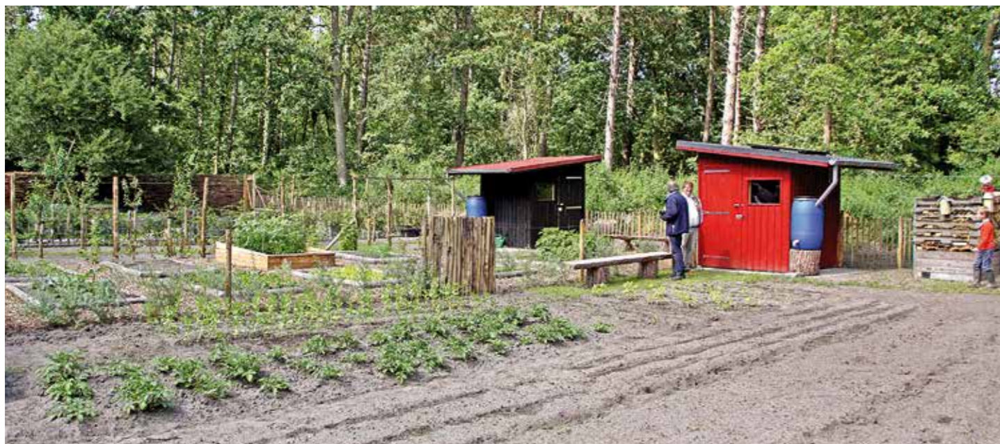
| 'De ideale tuin' wordt verhuurd aan drie eilanders.