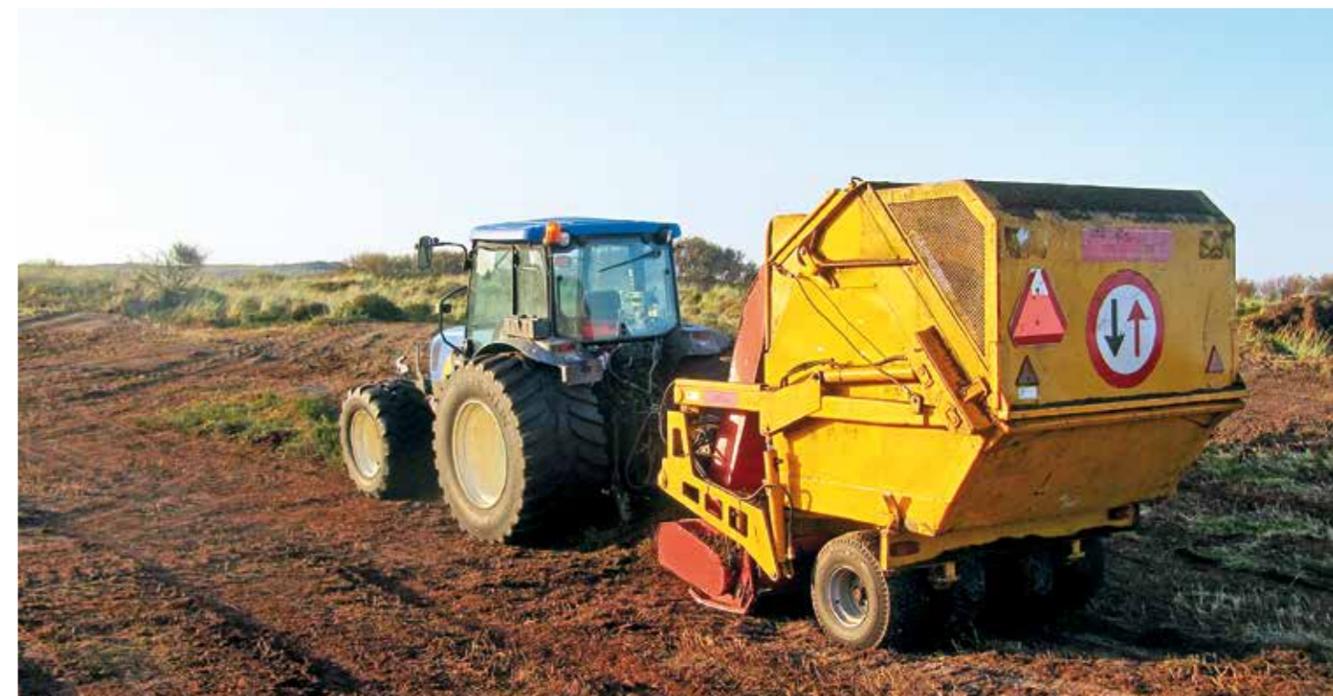
| Met een choppermachine zorgen we voor verjonging van de heide.

Lepelaarkolonie in Waterplak Een direct resultaat van het duinplassenherstel is de vestiging van een kleine kolonie lepelaars in het Waterplak. Deze vogels rustten hier al jaren, maar dit jaar hebben er acht paren genesteld. Het is daarmee de enige broedlocatie op Terschelling buiten de Boschplaat. Na de broedperiode verzamelden de vogels zich ook in het Waterplak, soms zaten er wel 50 bij elkaar. De aanwezigheid van water en het feit dat het Waterplak tijdens het broedseizoen is afgesloten voor publiek maken deze duinplas een ideaal broedgebied voor vogels. Daarom is het niet vreemd dat het hier nu mogelijk is om lepelaars te zien broeden, met West aan Zee op de achtergrond.