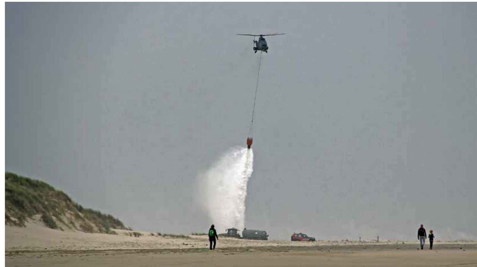
| Met een blushelikopter zijn tijdens een oefening brandende doelen op het strand geblust.

Een bijzondere broedvogel op de Boschplaat, vrijwillige vogelwachters zagen een middelste zaagbek met jongen. Deze eendesoort broedt doorgaans in noordelijker streken en wordt de laatste jaren steeds vaker in Nederland als broedvogel gezien.