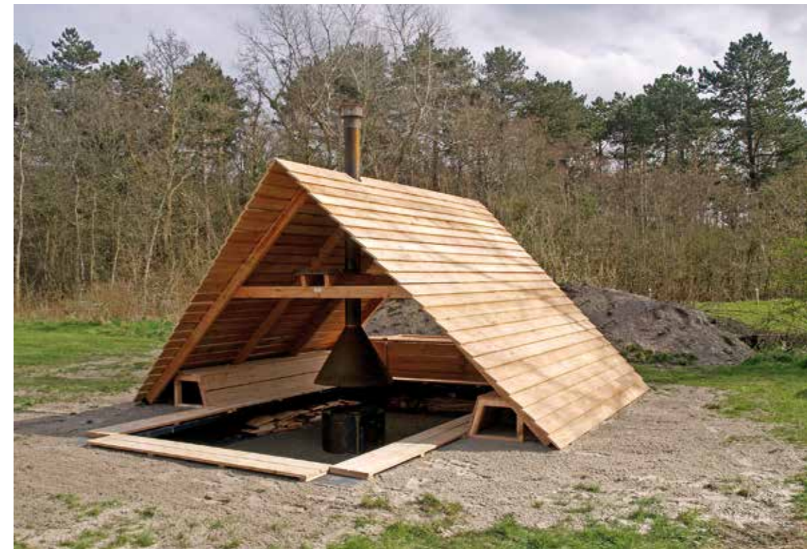
| De vuurhut op Natuurkampeerterrin West-Terschelling.

Wie het kleine niet eert, is het grote niet weerd. Daarom hebben we de verkoop van onze merchandise op het eiland verder uitgebreid. Onder andere bij de VVV zijn verschillende producten te koop, variërend