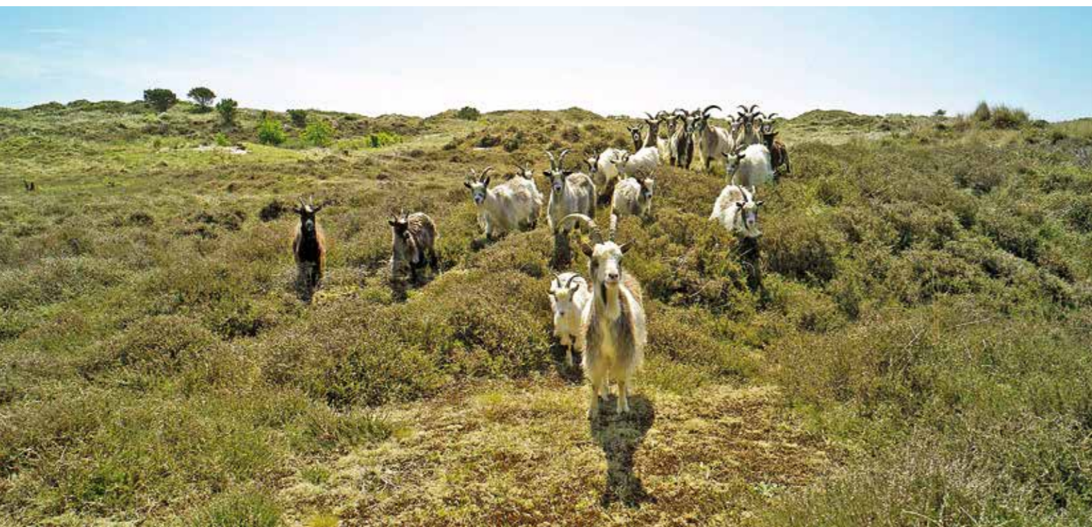
| We zetten geiten in om duinen van bomen en struiken te ontdoen.

Van West-Terschelling tot Oosterend laten we in de winter grote delen van de duinen begrazen, waaronder dit jaar voor het eerst het duingebied ten westen van de Badweg van Paal 8 door pony's. Deze winterbegrazing heeft een erg goed effect op de plantengroei. Daarnaast zien we dat in de begraasde stukken de zeldzame tapuit toeneemt. Bijzonder, want in de rest van Nederland gaat deze soort hard achteruit.