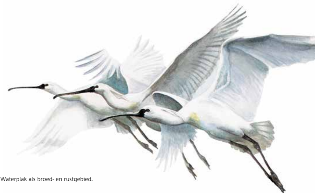
| Lepelaars gebruiken het Waterplak als broed- en rustgebied.

Chopperen dankzij droog weer Wanneer een duingebied erg verruigd is met bijvoorbeeld kruipwilg, is begrazen niet voldoende om het gebied weer open te krijgen. In dat geval is chopperen een optie. Met een choppermachine verwijderen we de planten en struiken plus het bovenste laagje van de bodem. Duinheides krijgen hierdoor weer een goede kans. De droge zomer heeft ervoor gezorgd dat we dit jaar delen hebben kunnen chopperen die normaal te nat zijn. Bij het uitkiezen van locaties hebben we ook gelet op de aanwezigheid van de appelbes. Deze exoot maaien we zoveel mogelijk af omdat hij anders inheemse plantensoorten verdringt.